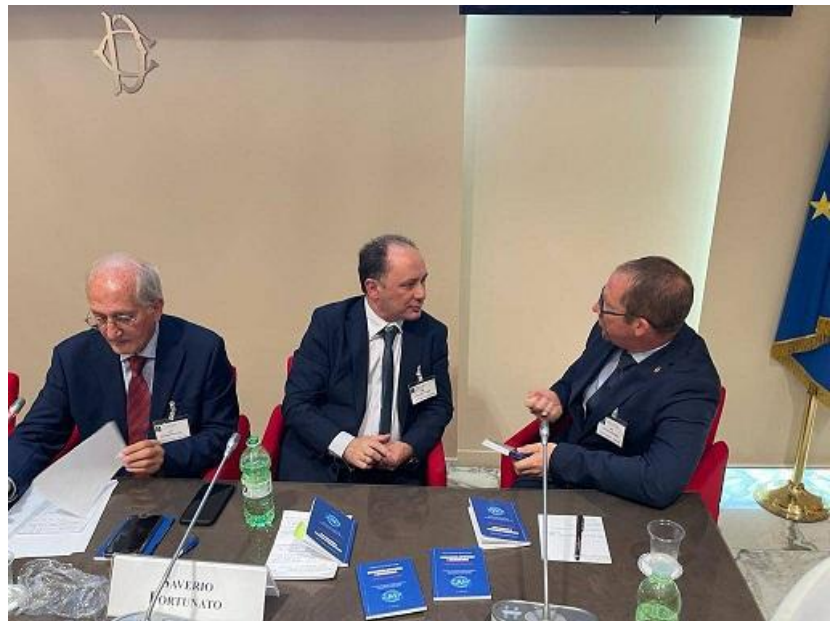
Insieme al Dr Mar S. Champlin (Direttore NCIS Ambasciata USA) Camera dei Deputati

Autorizzo il trattamento dei dati personali contenuti nel mio CV ex art. 13 del decreto legislativo 196/2003 e art. 13 del regolamento UE 2016/679 sulla protezione dei singoli cittadini in merito al trattamento dei dati personali